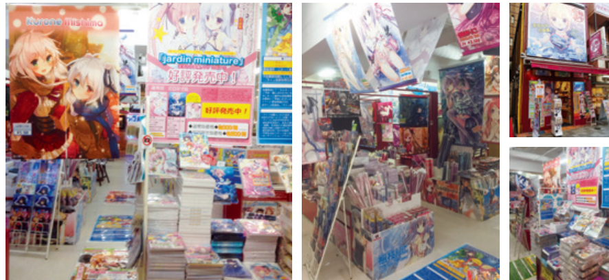
タペストリー販売本数年間5万本以上を誇るイラストグッズ専門店「軸中心派」。作家との強力な関係性により、独自のオリジナル商品を発表する一方、同人誌の取り扱いも開始し、取扱作家数を大幅に伸ばす。現在は秋葉原・名古屋・大阪日本橋をメイン店舗とし、全国に5店舗を運営。

オリジナルコンテンツの創造をつづける軸中心派グループでは、イラスト集・雑誌の出版を軸に、関連グッズの販売を強化しています。タペストリーを中心に扱う「軸中心派」店舗では、新たに同人誌の取り扱いを開始し、より多くの作家のコンテンツを扱うようになりました。本年度は通販・催事も充実し、さらに売り上げの飛躍を目指しています。その他、アーティストとの強いパイプでイベントを開催し、台湾での定期的な作家イベントや、国内での作家対談など、ファンと作家との交流の懸け橋の役割も担っています。