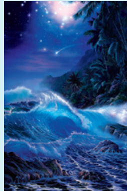
Star Dancer © CHRISTIAN RIESE LASSEN

に在住。1976年より作品を 発表。イルカやクジラなどの 海洋生物やハワイの大自然を リアルに描き、マリンアートの ジャンルを確立した。1990年、私財を提供し環境 保護団体「シービジョン財団」 を設立。現在も、地球温暖化 会議への協力や様々な環境保 護活動に積極的である。