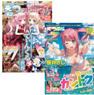
年6回発行の定期誌 E☆2 (えつ)