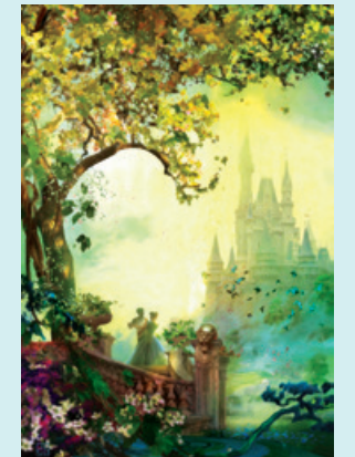
Golden Hour

1962年、フランス生まれ。パリの美 術学校を卒業後、DICエ ンターテイ ンメント社のアニメーター としてスタートする。アメリ カに渡り、作品がエミー 賞にノミネートされる。そ の後、様々なテーマパーク やアトラクションの設計に も携わり、現在ではユニ バーサル・スタジオ、パラ マウント映画などで近未来 志向の映画の制作にも携 わっている。