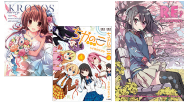
大人気イラストレーターの画集から カレンダーまでを 作家プロモーションも考えながら出版