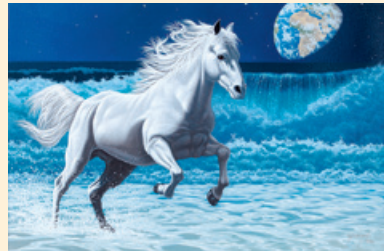
Wave Runner © Schimmelsmith Publishing

めるシュールリアリズム”という独自の画風を確立し、 WWFなどの環境保護団体に所属しながら創作活動を続 けている。自然環 境保護や動物への 愛情あふれる創作 テーマとダイナ ミックな画風が幅 広い層から支持を 得ている。