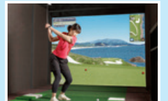
ゴルフシミュレーター