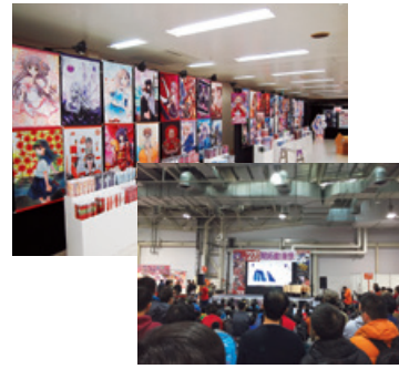
自社イベント「軸中心祭」から、 大型イベント「コミックマーケット」まで、 様々なイベントに出店。 ステージイベントや作家サイン会を開催。

オリジナルコンテンツの創造をつづける軸中心派グループでは、イラスト集・雑誌の出版を軸に、関連グッズの販売を強化しています。タペストリーを中心に扱う「軸中心派」店舗では、新たに同人誌の取り扱いを開始し、より多くの作家のコンテンツを扱うようになりました。本年度は通販・催事も充実し、さらに売り上げの飛躍を目指しています。その他、アーティストとの強いパイプでイベントを開催し、台湾での定期的な作家イベントや、国内での作家対談など、ファンと作家との交流の懸け橋の役割も担っています。