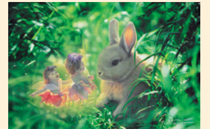
LOST BABY_オリジナル © KIRK REINERT

アルバムジャケットなどを制作。1998年、国際的権 威のある【スペクトラム ザ ベスト イン コンテンポ ラリー ファンタ スティック アート】 で銀賞を受賞。現 在はニューヨーク 郊外にアトリエを 構え制作活動を 続けている。