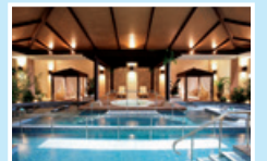
リラクゼーションプール