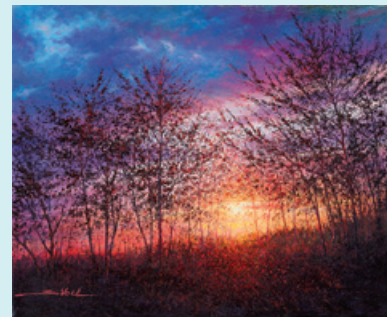
6290 天使に盗まれし情熱 F12 © SIBEL

東京のトルコ大使 館、1997年パリ、 1999年 ニュー ヨークなどで個展 を開催。2004年 よりマルマラ海に 浮かぶボズジャア ダ島にアトリエを 構え、創作活動を 展開している。