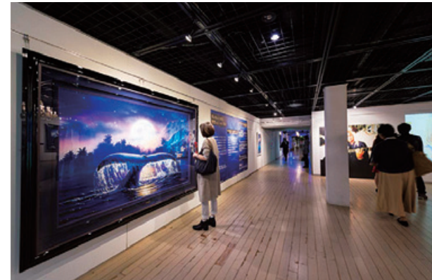
横浜赤レンガ会場

スタンダードアート部門におきましては、より多くの新たなお客様に絵を飾っていただくために、週末を中心に全国各地のショッピングセンターやイベントホールにおいて展示販売会を開催しております。最近では、デビッド・ウィラードソンをはじめとするディズニーアーティストの展示会「ドリーム・アート・ワールド」を積極的に開催し、より多くの新規のお客様に絵のある生活の喜びを感じていただいております。