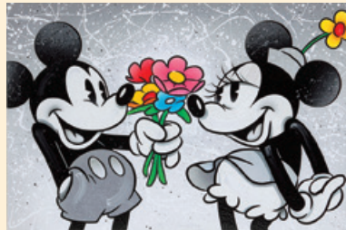
FLOWER POWER © Disney

ロサンゼルス出身。ディズニースタジ オで、アニメ作品「バンビ」、「シンデレ ラ」、「白雪姫」、「リトル・マーメイド」、 「アラジン」、「ライオンキング」などのポスターを一手 に手掛ける。ディズニーの伝統的な画風に従って描く 一方、エネルギーで色彩に富み、 ダイナミックで個性的なディズ ニーキャラクターを生み出している。