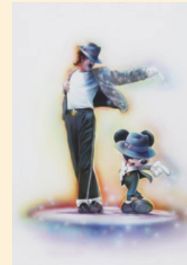
MICHAEL&MICKEY (MM)

年、マイケル・ジャクソンがプライベート コレクションとして所蔵する作品など を制作して一躍脚光を浴び、その後 マイケル・ジャクソンの肖像画を描く ために、プライベートゲストとして 「BAD」ワールド・ツアーに参加する。 1995年から本格的にファインアー ティストとしての活動を始め、現在多 くのディズニー作品も手掛け最も注 目されているアーティストである。