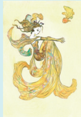
LaFruttaGiallo © YOSHITAKA AMANO

を築いたとも 言われる、竜の子プロダク ション時代のアニメーション 作品をはじめ、一世を風 靡した有名幻想小説の挿画 や、1987年以降、人気ゲー ムソフト「ファイナルファン タジー」シリーズのビジュ アルコンセプトデザインを 手掛けるなど、日本を代表 するアニメクリエイターで ありファインアーティスト。